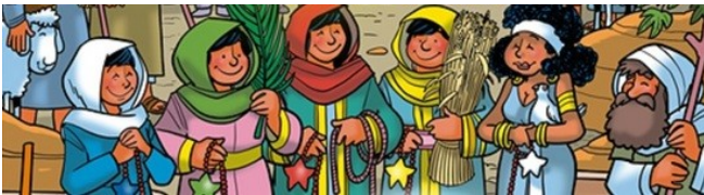
Tamar, Rachab, Ruth, de vrouw van Uría, en Maria

God van alle mensen, dankbaar gedenken wij in deze tijd dat Gij - onder alle vrouwen - Maria hebt willen kiezen om Jezus te ontvangen. Wij bidden U, maak van ons mensen naar uw hart en geef dat Jezus ook in ons mag leven als een genade voor onszelf en voor anderen vandaag en de dagen die komen . Amen.